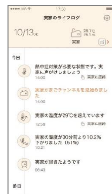
「まごチャンネル with SECOM」(左) と「みまもりアンテナ」アプリの画面 (中央、右)

「まごチャンネル with SECOM」は、離れて暮らす家族をゆるやかにつなぐ「たのしい、みまもり。」をコンセプトにした見守りサービスです。本サービスでは、ご実家の「まごチャンネル」本体に接続した環境センサーからの情報をもとに、ご家族は「みまもりアンテナ」アプリを使って、離れて暮らす親御さんの起床や就寝、部屋の温湿度、照度の確認や、熱中症危険度のお知らせなどを受け取ることができます。