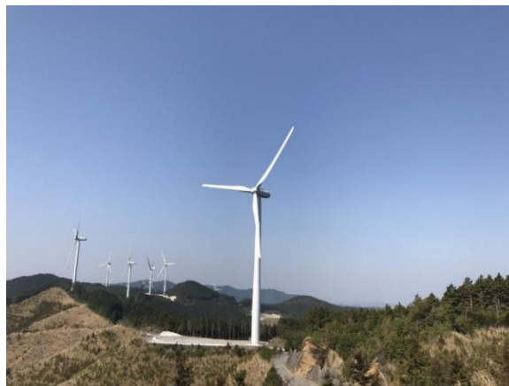
中紀ウィンドファーム

今後、新設の再エネ発電所を活用し、長期安定的な再エネの利用を拡大しつつ、自社の排出削減のみならず、社会全体の再エネ比率の向上に貢献していきます。