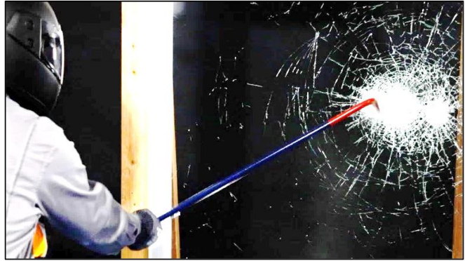
大型破壊器具を使ったガラス破壊に対しても非常に高い防犯性能を発揮

警察庁の統計 ※3 によると、2023年の刑法犯の認知件数は2年連続で上昇、侵入犯罪の認知件数も前年比で19.1%増加するなど、犯罪情勢の悪化が懸念されています。セコムが行った調査 ※4 においても、昨年不安を感じた出来事として「空き巣などの住宅侵入」や「強盗事件」が上位に入ったほか、今後の治安悪化や犯罪増加に不安を感じている人が76.0%に上るなど、「安全・安心」へのニーズが高まっています。