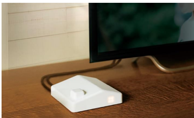
「まごチャンネル with SECOM」の本体

セコムの“共想”で生まれる協働プロジェクトブランド「SECOM DESIGN FACTORY」の第一弾の商品になります。