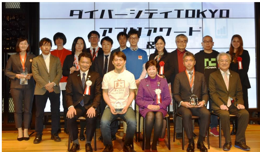
「ダイバーシティ TOKYO アプリアワード」表彰式

セコム株式会社(本社：東京都渋谷区、社長：尾関一郎)と“シニア・ファースト”をミッションに掲げる IoT ベンチャー企業の株式会社チカク(本社:東京都渋谷区、共同創業者兼代表取締役：梶原健司)が協働で開発した「まごチャンネル with SECOM」が、東京都が主催する「ダイバーシティ TOKYO アプリアワード」のアプリ部門において、最優秀賞を受賞しました。