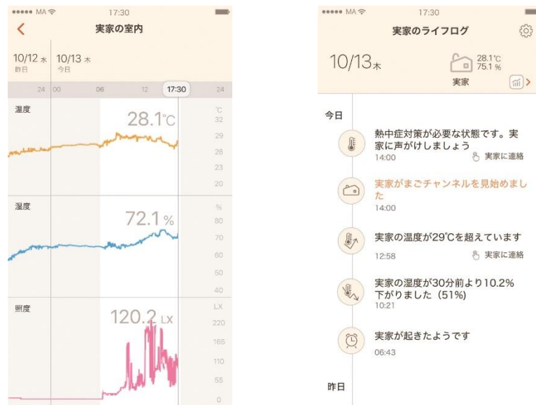
「みまもりアンテナ」アプリの画面

また、照度の変化と生活音の有無により、親御さんの起床や就寝を判断し、アプリに「起きたようです」「寝たようです」と通知するほか、温湿度の急激な変化をはじめ、熱中症の注意喚起などもお知らせします。