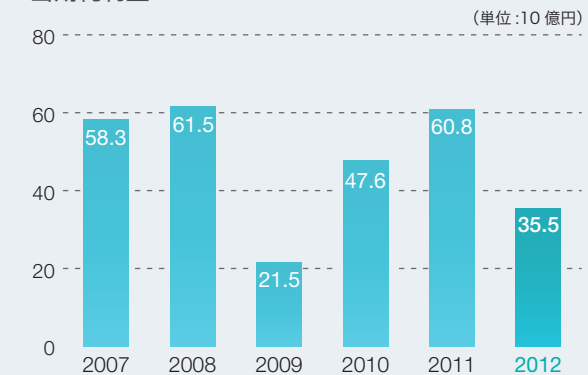
日本会計基準 当期純利益

注記：1株当たりの配当金は、期中に承認され、支払われた額を表示しています。2012年3月31日決算後の同年6月26日の定時株主総会において、1株当たり90.00円の配当金が承認されました。