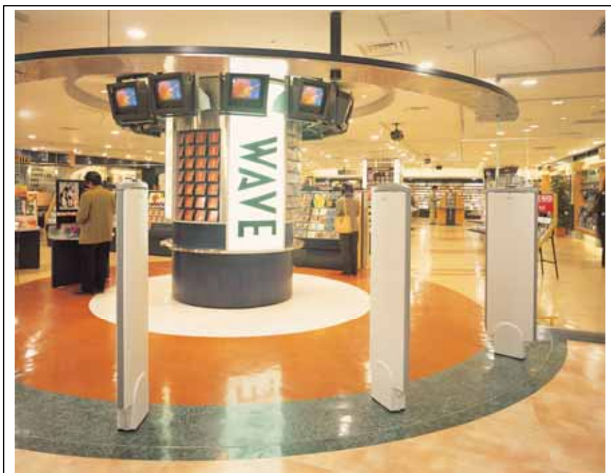
万引き防止システム