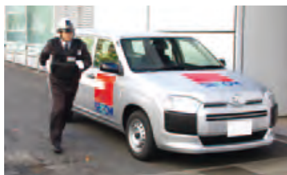
セコムの低燃費車

セコムがめざす安全で快適な暮らしの基盤が地球環境の保全であるという認識のもと、全社員で「環境基本理念」、「環境基本方針」を共有し、地球温暖化防止や資源有効利用などの環境施策の推進と法令遵守等の強化に取り組んでいます。