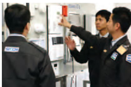
知識と技能を高める人材育成

また、お客様訪問やセコムお客様サービスセンターなどを通じ、お客様の声に常に耳を傾け、さらなるサービス品質の向上に努めています。