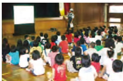
セコム子ども安全教室

この認識のもと、子どもや女性、高齢者に対する防犯意識の啓発活動など、さまざまな社会貢献活動を行っています。