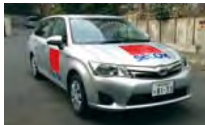
セコムの低燃費車

セコムがめざす安全で快適な暮らしの基盤が地球環境の保全であるという認識のもと、全社員で「環境基本理念」、「環境基本方針」を共有し、地球温暖化防止や資源有効利用などの環境施策の推進と法令遵守等の強化に取り組んでいます。