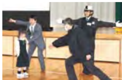
寸劇など動きを取り入れた防犯授業

この認識のもと、子どもや女性、高齢者に対する防犯意識の啓発活動など、さまざまな社会貢献活動を行っています。