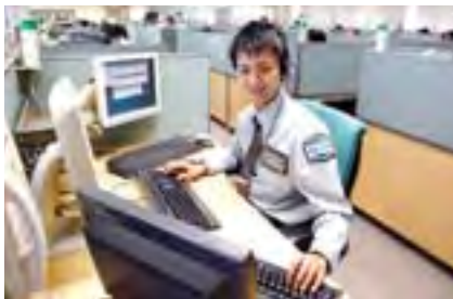
「セコムお客様サービスセンター」

また、お客様訪問やセコムお客様サービスセンターなどを通じ、お客様の声に常に耳を傾け、さらなるサービス品質の向上に努めています。